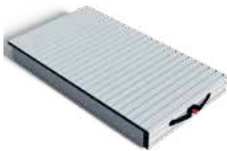
Teleskop-Geräteauszug V 810