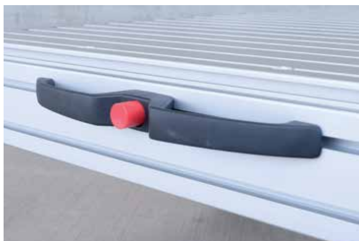
Doppelhandgriff mit Entriegelungsknopf