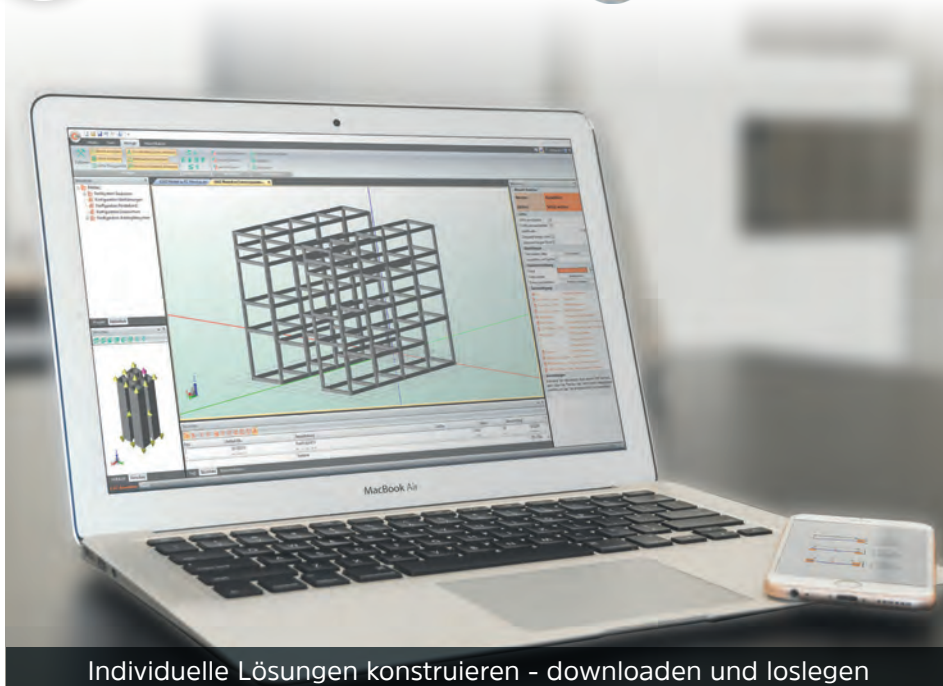
Individuelle Lösungen konstruieren - downloaden und loslegen